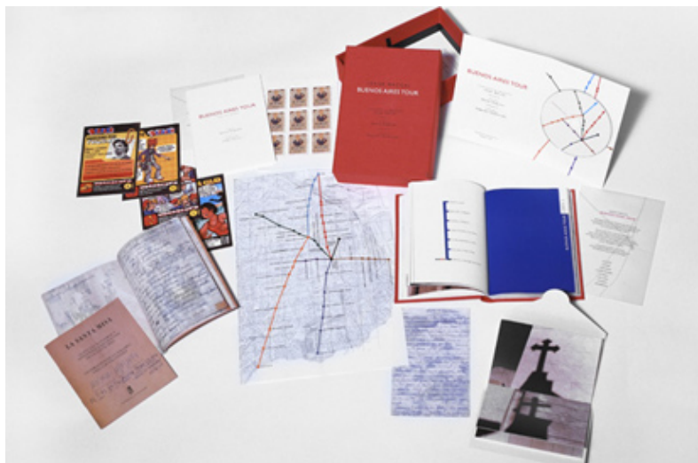
07 – Buenos Aires Tour – Jorge Macchi. En Colaboración con Edgardo Rudnitzky (sonidos) y María Negróni (textos) – Libro-objeto 15,5 x 21,5 x 6,5 cm.

un cambio en quien contempla y recorre la obra. Dos producciones así requieren espacios diferentes. El espacio exterior (aunque sea dentro de una galería) de la instalación y el espacio íntimo del libro de artista.