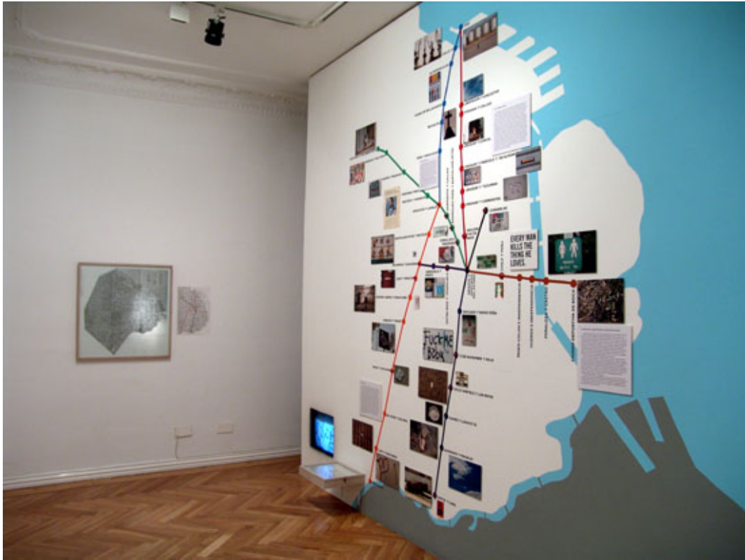
01 – Buenos Aires Tour – Jorge Macchi. En Colaboración con Edgardo Rudnitzky (sonidos) y María Negroni (textos). Instalación – dimensiones variables. Vista gral. 2 de la exposición en la Galería Distrito 4, Madrid, España, 2003

“Buenos Aires tour” consta de 8 itinerarios que reproducen la trama de un vidrio roto sobre el plano de la ciudad de Buenos Aires. La rotura del vidrio estructuró el viaje. A lo largo de esas 8 líneas o recorridos por la ciudad, se eligieron “x” puntos de interés sobre los que la “guía” proporciona información escrita, fotográfica y sonora. Los 46 puntos elegidos dentro de esos itinerarios coinciden con cruces de calles y avenidas importantes.