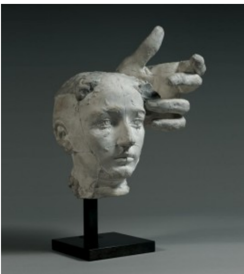
Máscara, Camille Claudel, por Rodin.