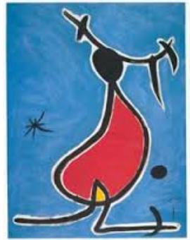
Pájaro, Joan Miró

Primero fue aprendiz y, cuando tuvo experiencia en el manejo de la máquina, se convirtió en operaria. Quizás un exceso de confianza- o porque las cosas cuando tienen que suceder, suceden nomás-un día el mecanismo arrastró su mano derecha. Su hemisferio izquierdo era el dominante, eso la convertía en diestra. Ya no más la máquina. La muy atrevida le asestó varias amputaciones a la vez. Con la mano derecha se fueron la habilidad de ponerse los rúleros, la chance del pulgar hacia arriba en señal de aprobación y otros tantos ademanes, considerados, hasta entonces, equipaje permanente de su vida.