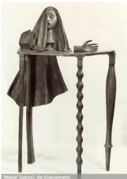
Mesa, Alberto Giacometti