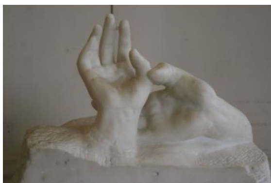
Manos amantes, August Rodin

Miraba a todas las manos ostentadas de a pares. Claro, ellas podían lo que ella una vez pudo. Y qué hacer con ese no poder. . ¡Que no le vinieran con la adversidad a la matriarca! A la lucha.