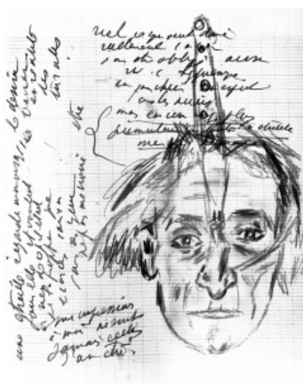
Dibujo, Antonin Artaud.