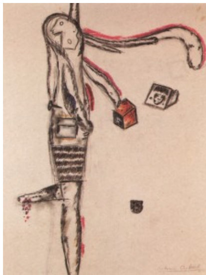
Dibujo de Antonin, 1946.

¿Qué hacer?: derribar el texto como único gesto, ése es el triunfo de la puesta. Es claro, que la lucha de Artaud no va contra cualquier palabra. Ataca, sobre todo, a la palabra como moneda de cambio, como herramienta de la supuesta comunicación. La palabra poética resuena, genera polisemia. Y, aunque aún ésta es expulsada de estas primeras tentativas de renovar el teatro, sigue teniendo para el poeta un valor diferente, recuperable, dentro de su mundo. Las palabras han sido cómplices indefensas, durante siglos, en la dicotomía cuerpo-alma. Pero, ¿qué es esto del alma? Me convierto en escéptica y la cuestiono. Acá lo real es esta materia viva con la que escribo, que me permite caminar, romperme. Entonces, podríamos cambiar incluso la concepción de la dialéctica académica del siglo XIX. Digámoslo de esta manera: en vez de cuerpo-alma, hablemos de la dialéctica del cuerpo, cuerpo-cuerpo.