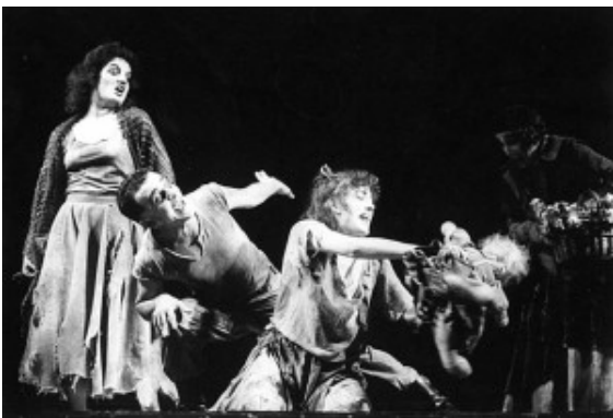
Antonin Artaud y Samuel Beckett.

Nietzsche decía que todo lo que se conserva se muere. Artaud, entre otros puntos, focaliza esta problemática en el cuerpo, la totalidad. Sin cuerpo no existe nada.