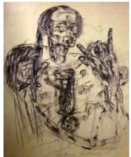
Autorretrato, Artaud 1972.

La escena se rompe. Decimos adiós al diálogo, al discurso. Ilustrarlo ya no es una escena, dice Jacques Derrida, en el “Antonin Artaud o la clausura de la representación”. ¿Entonces? En el teatro cruel, la palabra es una enfermedad.