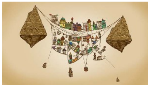
"Ottavia" – Las Ciudades Invisibles – I. Calvino

En el libro de Italo Calvino el narrador despliega un relato de ciudades imposibles. Están "Las ciudades y el cielo" (con propiedades divinas) "Las ciudades y el deseo" (despiertan el deseo y la pasión de las personas) "Las ciudades y la memoria" (de recuerdos manifiestos en sus habitantes o estructuras). En el final del libro dice: "El infierno de los vivos no es algo que será, hay uno, es aquel que existe ya aquí, el infierno que habitamos todos los días, que formamos estando juntos. Dos maneras existen de no sufrirlo. La primera es fácil para muchos: aceptar el infierno y volverse parte de él hasta el punto de no verlo más. La segunda es peligrosa y exige atención y aprendizaje continuos: buscar y saber reconocer quién y qué, en medio del infierno, no es infierno, y hacerlo