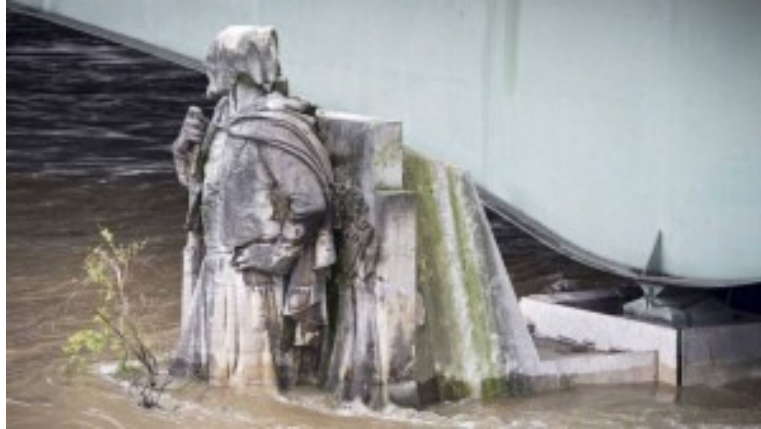
Obras sumergidas en la inundaciones de Francia

pertenecer. “Porque me duele si me quedo/pero me muero si me voy” , bien supo decir María Elena Walsh, en “Serenata para la tierra de uno” . Las crisis destierran en exilios y fugas de cerebros. Tierra maldita y bendita para nacer, con la incertidumbre de no saber en qué lugar morir.