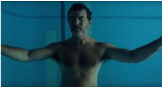
Dolor y gloria

Sumergido, detrás del azul. El cuerpo en suspensión. El afuera, apenas un murmullo. Él, dentro del agua limpia que te limpia los dolores de cabeza y espalda. Silencio es lo que se escucha en un set de filmación cuando la rueda rueda, cuando rodar no es desplazarse en círculos, sino crear movimiento desde la quietud. El pensar corroe a veces y, otras, limpia que te limpia tanta tristeza sumergida, que no hay espacio al resuello. El cuerpo se pone cuerpo y el tiempo se cristaliza en la vejez de los órganos y en la cabeza de la espalda. Según la anatomía ortodoxa de la mirada de libro, pueden ser hombros. Pero, para la textura del padecimiento, el dolor no tiene cuerpo. Y, claro, la ausencia del cuerpo no es solamente la no presencia del deseo.