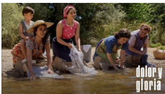
Dolor y gloria

creador y al vértigo del caos que desordena la mirada. Sin repetir y sin soplar, se dice que una imagen o escena respira, cuando fluye a la par de un relato. Y, si fluye a la par, le escapa a la cárcel de la mirada que etiqueta en un género único para degenerarse y así recrearse en cada imagen yuxtapuesta. Esto mismo, en teatro, no se puede recrear en el instante de la representación. Pero estamos en el cine.