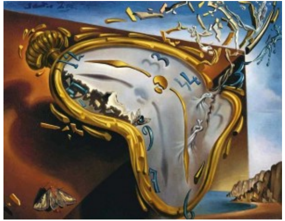
Salvador Dalí – Reloj blando en el momento de su primera explosión (1954)

En las películas de Pedro Almodóvar, los colores siempre juegan un efecto emocional, no desde la imagen en sí, sino en la manera de aparecer como atmósfera de los personajes. No por nada, en los créditos del comienzo de su última película, "Dolor y Gloria", el director manchego elige la irrupción de colores en movimiento, como si se tratara de un fractal. El fractal no es importante por el movimiento, sino por el orden, que no se aprecia en el movimiento de los colores. Ellos se mezclan y pueden generar alguna figura que se repite. Porque el cine, en un rodaje, es el arte de la repetición de una representación. Repetir una situación hasta llegar a la verdad escénica es el sueño de todo cineasta devenido director. Y la verdad escénica es la nulidad de la representación. Así, como en el teatro, donde la representación se diluye en la ruptura de la expectación de la mirada. La mirada del otro es el complemento y es el cuerpo que no se ve. Como un cuadro, donde las manchas de colores a la distancia dejan de serlo. De allí, el primer recuerdo de Salvador y de Pedro: su madre, con otras mujeres, lavan las sábanas blancas a orillas del río. Recuerdo que se vuelve el reverso del reflejo de una representación, al llegar la música del canto y la escena recordada, casi pintada por los ojos del niño que se hizo grande, mientras miraba cine y pensaba en qué quería convertirse de adulto. Volvemos, sin elipsis y sin fundidos, a la duermevela del ensueño del