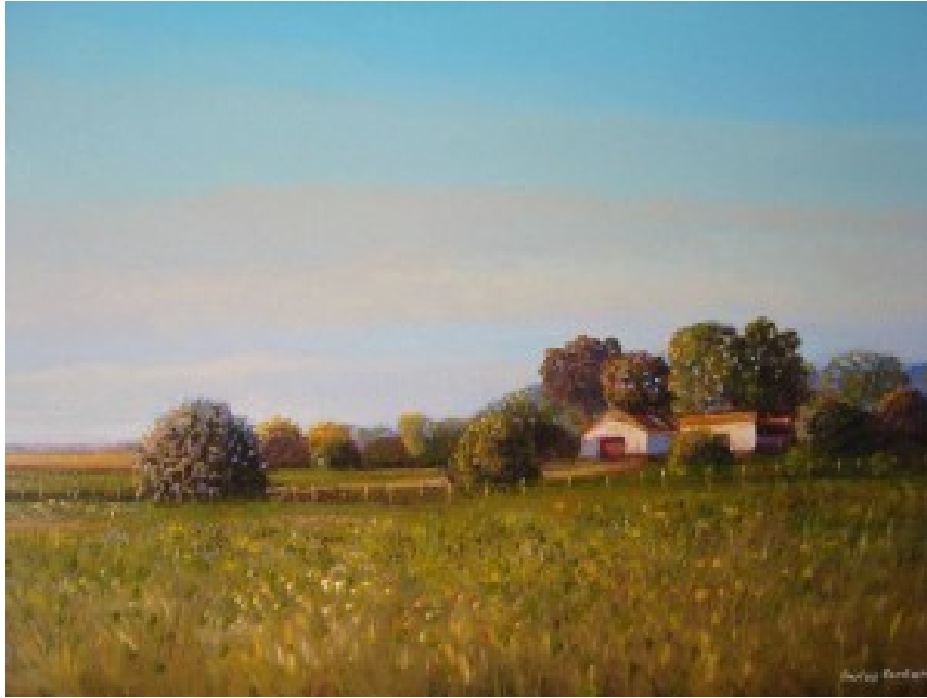
Paisaje, Carlos Cordaro