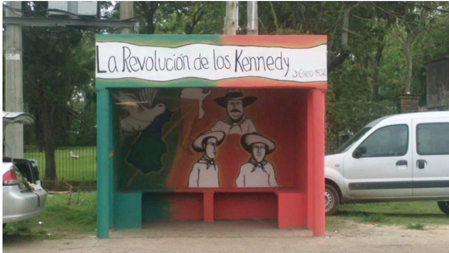
Milagros Ríos, "La revolución de los Kennedy"