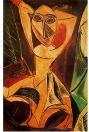
“La bailarina de avignon”de Pablo Picasso