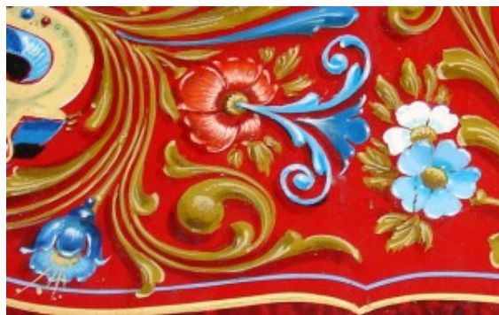
“Flores” de Ricardo Gomez

La abuela Rosa estaba resignada, ya no puteaba. Mi abuelo tenía medidas medias para todo, excepto para el fileteado. Sus pensamientos y hojas enredadas entre claveles eran magníficos. Sus dibujos, de una belleza increíble. Todavía recuerdo la silla para comer que me hizo: blanca y decorada. Sentado en ella, yo me sentía en un hermoso jardín de hadas. Se lo llevó un cáncer silencioso, pero nos dejó sus filetes.