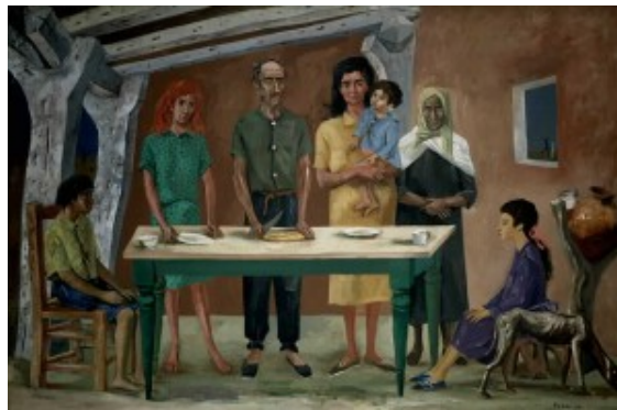
Antonio Berni, "La comida", Pigmento al agua sobre tela, 1953

nada". Por su parte, en "Un silencio de corchea", durante un concierto, ocurre una invasión de bichos que avanzan sobre las partituras, los músicos y, en particular, sobre la espalda y la oreja de la pianista. El violinista decide liberarla del monstruo. Para ello, recurre al arco de su violín, en el momento de un silencio de corchea. Entonces: "La muerte de ese bicho significó el fin de mi carrera musical. Los remordimientos me impidieron seguir tocando". (2)