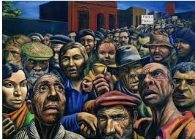
Antonio Berni, La manifestación, Temple sobre arpillera 1934