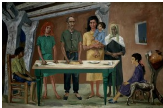
Antonio Berni, "La comida", Pigmento al agua sobre tela, 1953

nada". Por su parte, en "Un silencio de corchea", durante un concierto, ocurre una invasión de bichos que avanzan sobre las partituras, los músicos y, en particular, sobre la espalda y la oreja de la pianista. El violinista decide liberarla del monstruo. Para ello, recurre al arco de su violín, en el momento de un silencio de corchea. Entonces: "La muerte de ese bicho significó el fin de mi carrera musical. Los remordimientos me impidieron seguir tocando". (2)