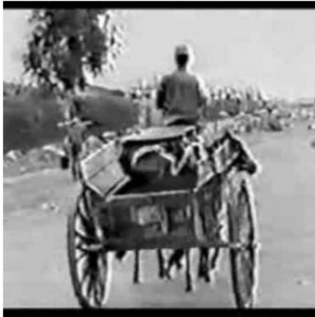
Fotograma de “Ya es tiempo de violencia” largometraje de Enrique Juárez