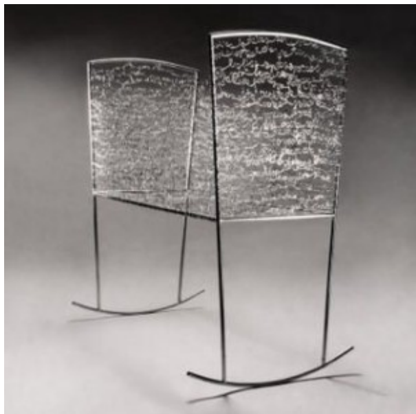
Fotografía: Viviana Macías, "Cuna".

mantener a un niño. Todos a quienes intenté adoptar andaban entre nueve, diez y once años. Aquel tenía diez. Después que rechazaron mi pedido de adopción, me jubilé. Y, al muy poco tiempo, falleció mamá.