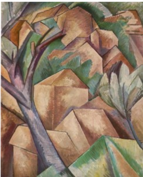
“Casas en el estaque” de Georges Braque

Enclavada en un cuadrado perfecto, la circundaban los árboles raídos, o eso creo. En el lateral, la cancha de bochas apaciguaba las letanías de los cuerpos encorvados en su desfile mañanero.