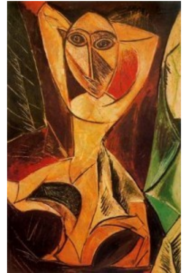
“La bailarina de avignon”de Pablo Picasso