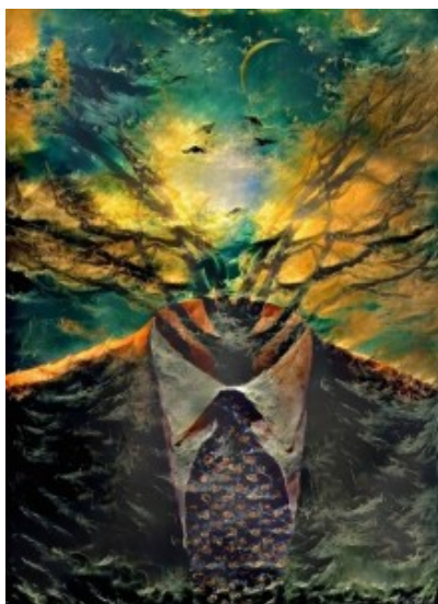
“Tree branches” de Bruce Rolff

El patio era grande e irregular, con un gran duraznero fortachón en el centro y un asiento de ladrillos a su alrededor, donde mi abuelo se sentaba con el plato de comida en la mano, mientras enarbolaba una cuchara amenazadora. Por mi parte, yo andaba en mi triciclo lentamente e intentaba evitar a mi abuelo para no abrir la boca y tener que comer el puré de calabazas con lomo picado. Era un chico inapetente. “Tenés que cargar combustible”, me decía el Nono. Ahora entiendo la paciencia de aquel hombre ante el primogénito flacucho, que obsesionaba a toda la tribu con su manía.