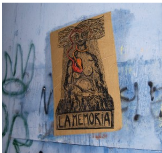
Grabado – Dini Calderón

Continente” y, el siguiente, “Colón o Colombo, el genio inmortal”. A lo largo de la obra –cuenta G. Fiscella- Poncela describe a los naturales de estas tierras como nobles y generosos, en contraposición a los españoles, a quienes caracteriza la codicia.