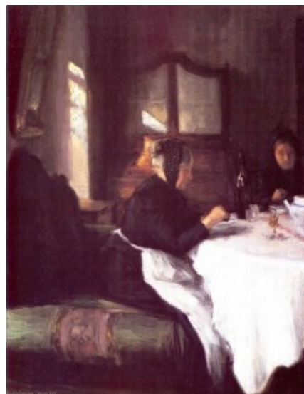
Istvan Reti – Old women

La novela, conocida en nuestro país el año pasado como “Prohibido morir aquí”, fue publicada en Gran Bretaña en 1971, bajo el nombre de “Mrs. Palfrey at the Claremont”. Una vez más, parece interminable la cadena de sustituciones pero, en verdad, el título que se le ha dado localmente contiene un misterioso atractivo y condensa uno de los temores manifiestos de la protagonista. En ese micromundo, morir es casi un acto de mal gusto.